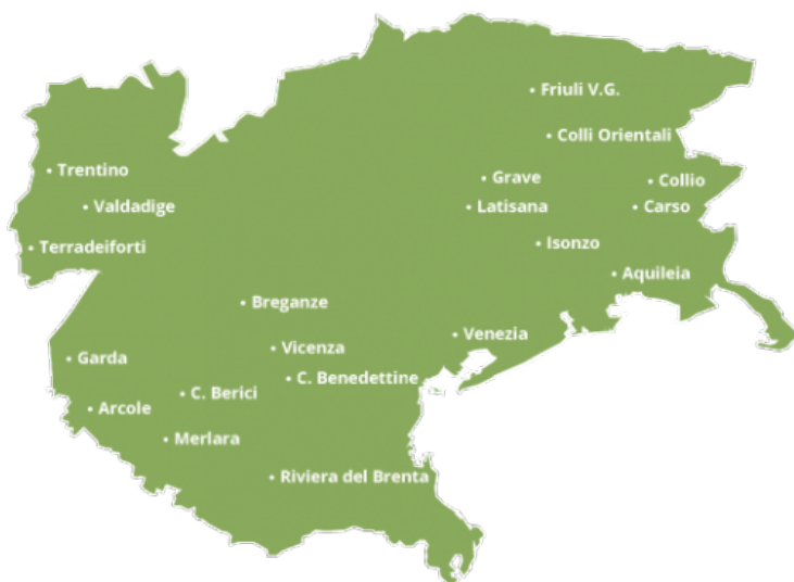
La cartina della denominazione

La Denominazione sostiene la formazione di un tavolo di confronto nazionale che lavori per aumento del valore e riconoscimento del Pinot grigio.