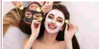
Scrub, vitamine e aloe: così l’abbronzatura dura a lungo