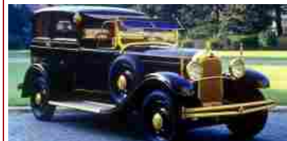
Lictoria Six la Citroen di Papa Pio XI