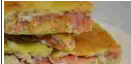
Pizza e fichi, ecco il bello di settembre