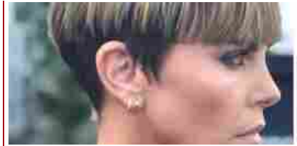
Charlize lancia la nuova moda, tutte pazze per il bob