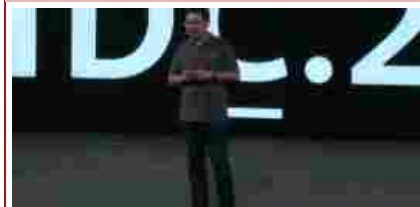
Huawei svela HarmonyOS, sistema operativo alternativo ad Android