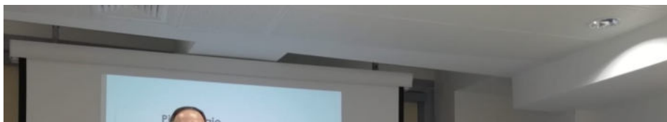
#WMNEWS Enotecche: mille in Lombardia su 7 mila in Italia